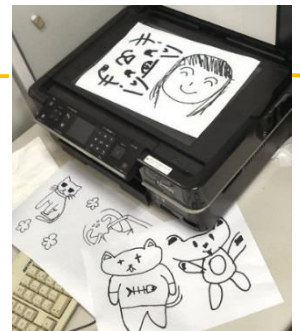
図2 手描きの図柄と取込装置