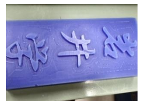
図7 完成品(文字のみ)