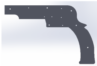
1 部品(フレーム部品)