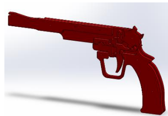
組み立てた輪ゴム銃

あなただけのオリジナル輪ゴム銃 てっぼう を完成 かんせい させて遊びましょう！