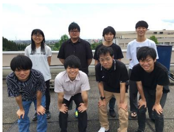
石坂 研究室 (電子・情報工学科)